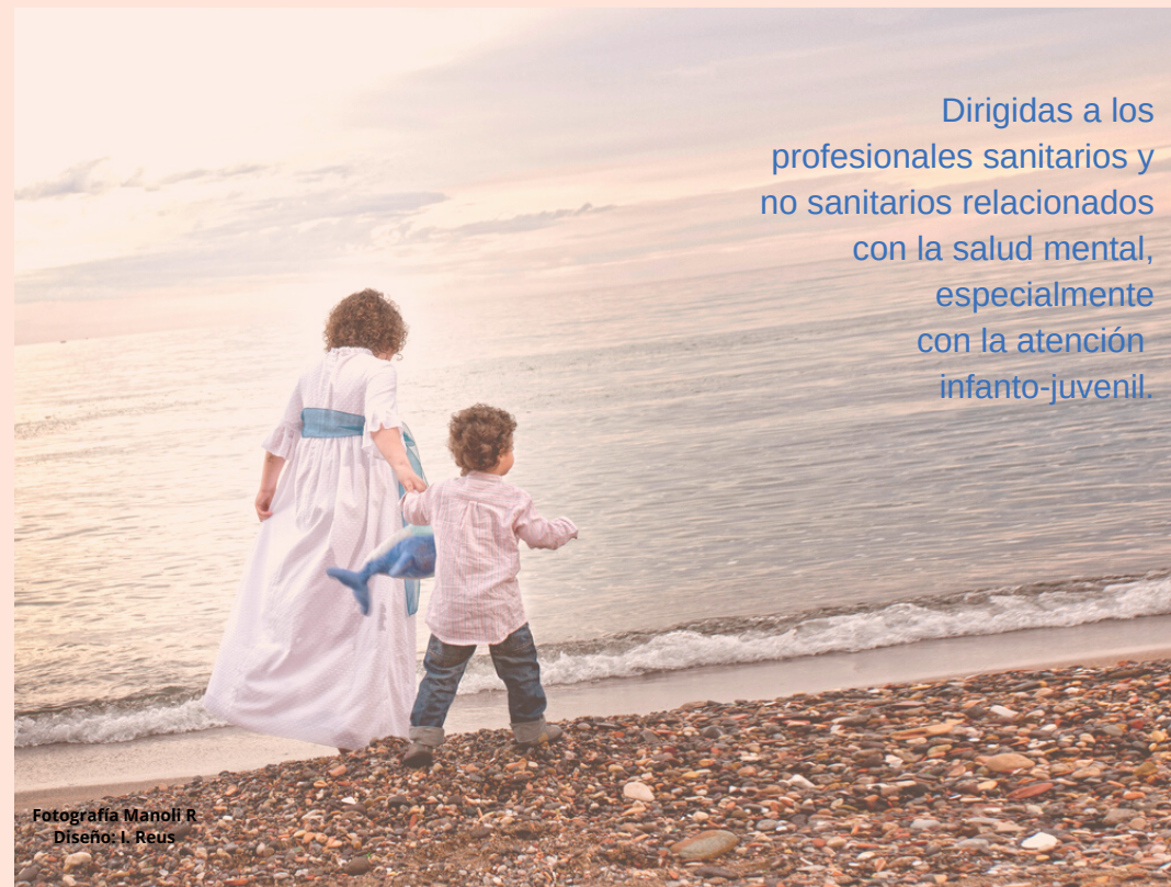
Diseño: I. Reus

Dirigidas a los profesionales sanitarios y no sanitarios relacionados con la salud mental, especialmente con la atención infanto-juvenil.